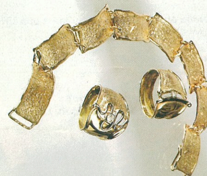
Hringir og armband, hvort tveggja smíðað úr gömlu gulli.