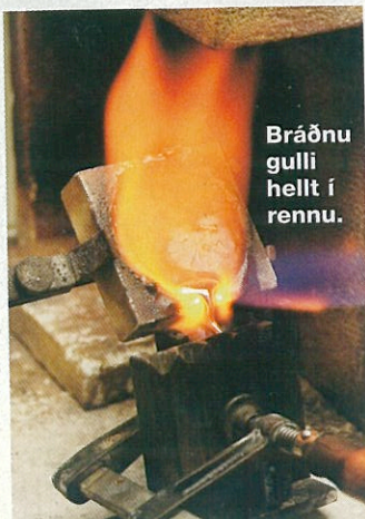
Bráðnu gulli hellt í rennu.